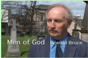
•Bere estatus-a finkatu behar da