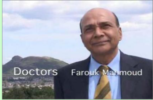
•120. egunean arima